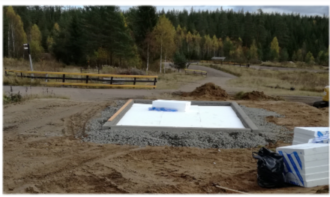
Formning för plattan till sekretariatet.

Det är dock inget vi prioriterar just nu. Anbudsboden har fått el indragen och är nästan färdigisolerad.