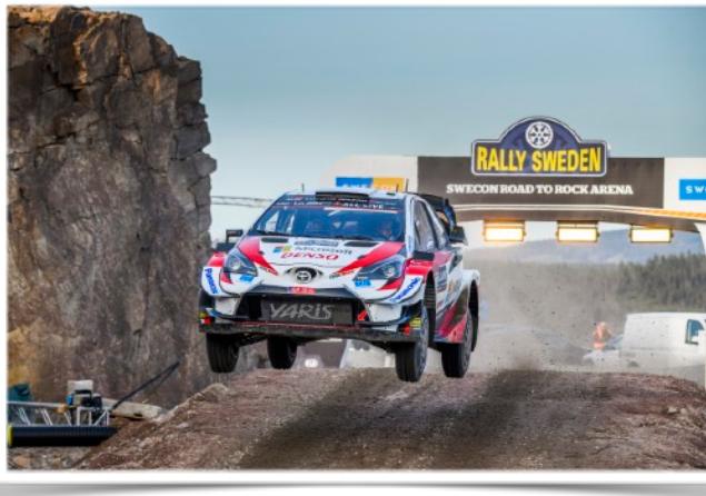
Torsby Sprint var nytt uppdrag för i år för MMC med nya utmaningar

Rallyåret 2020 startar som vanligt för MMC redan innan 2019 är över, detta med Funktionärs-träffar inför Rally Sweden 2020. Nytt för Rallysektionen i år var att MMC lovat att hjälpa MK Ratten med deras Torsby sprintsträcka under Rally Sweden, sträckan ligger nära flygplatsen i Torsby. MMC bemannade sträckan med flera chefsfunktionärer och ca 20 publikvakter.