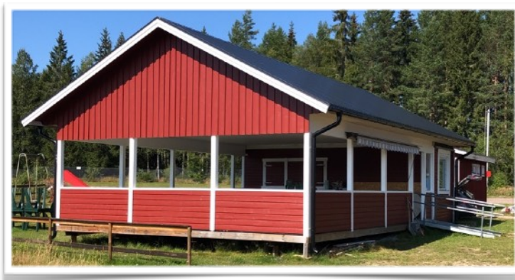
En cafeteria så röd och grann.... I år gjordes en stor insats med färdigmålning av vår nya cafeteria.

Det efterlängtrade sekretariatet blev påbörjat. Grunden är färdig så nu är det "bara" resten kvar. Bangruppen fortsätter med sina förberedelser inför banutbyggnaden. Vi har skickat in en nominering till XL-hjälpen angående toalettbyggnaden som verkligen behöver en uppfräschning. Vi håller tummar och tår och hoppas på tur. XL