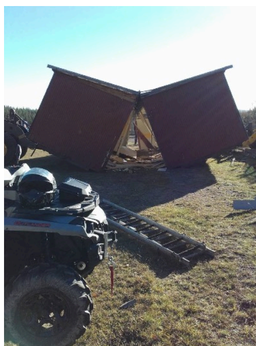
Gamla cafeteria rivs av hjullastare från MÅAB och Munkfors Trädgårdstjänst

De lyckade tävlingarna har gjort att sektionens ekonomi är mycket god. Detta är tur för i skrivande stund har vi ingen cafeteria på Tomtfallet. Den rev vi under senhösten och tanken är att det ska stå en ny cafeteria på plats innan tävlingen den 10 juni. Vi har en barack som är iordninggjord på utsidan som ska inredas och ställas på plats och så ska det till ett golv utanför den. Den nya cafeteria kommer att stå på samma ställe som förut men den blir mindre och till en början bara som en kiosk. Planen är att så