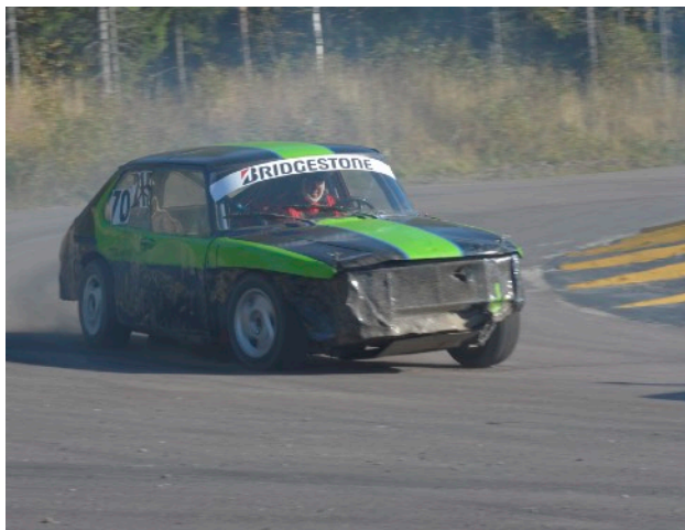
Klubbmästare Per Nilsson in action.