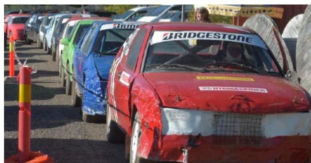
Lång kö till start i oktobertävlingen